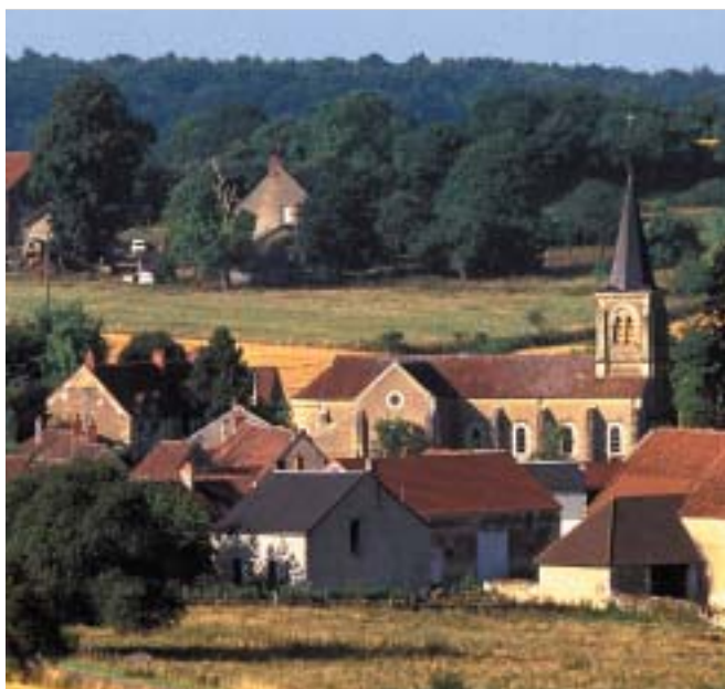
Église, mairie, bâtiments agricoles... Pour bien assurer le patrimoine communal, il est indispensable de procéder à un inventaire détaillé.

Face à la croissance de leurs responsabilités, les communes doivent rendre la gestion de leurs assurances plus dynamiques. Découvrez tout ce qu'il faut savoir sur les principaux risques juridiques auxquels vous et votre commune êtes confrontés.